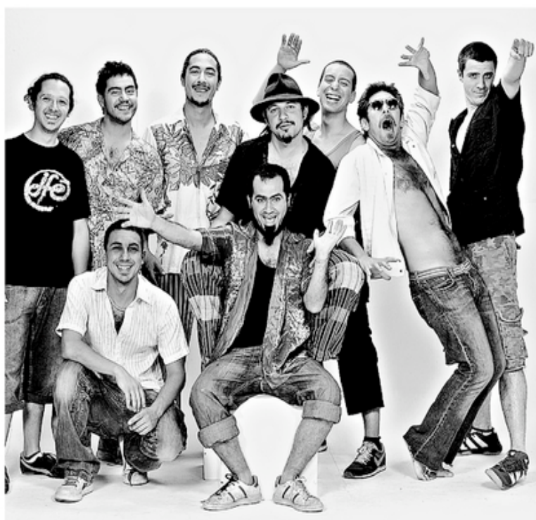
EN LA ZONA. El grupo se encuentra realizando su gira "JuanaFé trepa por Chile", que los tendrá hoy en Lebu y el 21 de febrero en Penco.

El año que pasó fue una gran temporada para JuanaFé. De la mano de su tema "Callejero", ganaron en popularidad y se hicieron conoci-