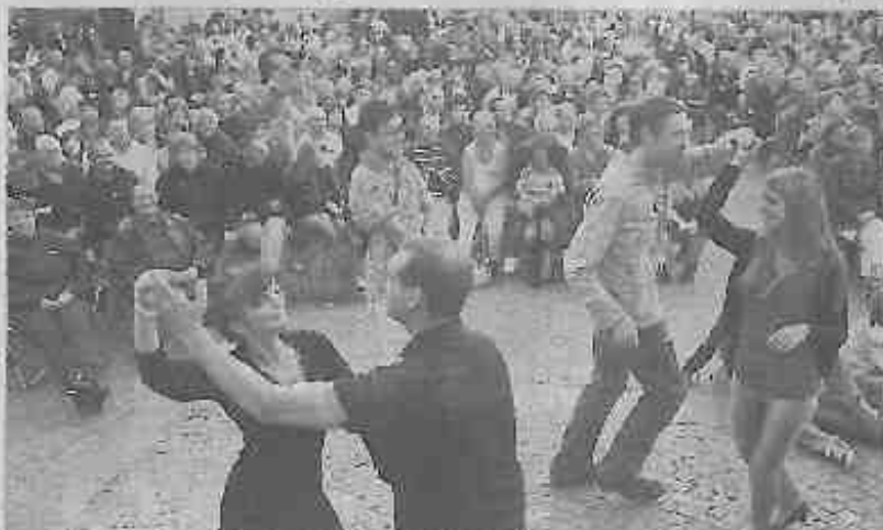
Le public est rapidement entré dans la danse... Il faut dire que les sonorités du groupe chilien engendrent tout sauf la monotonie.