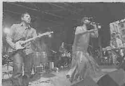
Les huit musiciens de Juanafé ont fait découvrir leurs influences au public d'Epinal bouge l'été vendredi soir.